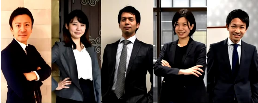
一橋大学大学院 板橋チーム

アウトプット(実践) を意識した 学び につながる！ 濃厚 で 質の高いチームワーク から 生涯の友 を！